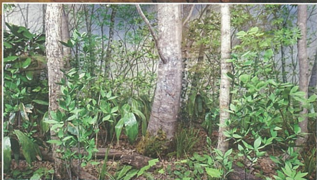
ブナ林のジオラマ

ブナ林の豊かな恵みを受けて、古代に始まった「たたら製鉄」は近世に入ると、中国山地は日本最大の製鉄団地に成長し、その中から特有の森林文化が生まれます。その森林文化のひとつとして岩倉牛に起源をもつ「吾妻蔓」の育成に焦点を当て、やがて、日本一の和牛となる比婆牛を育てた比和の畜産農家の努力を理解して頂けるよう構成されています。