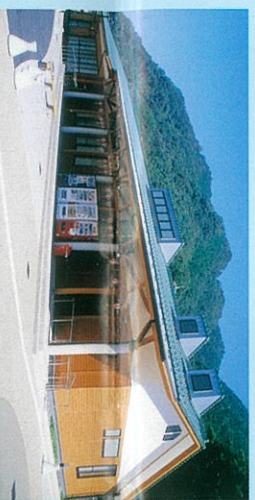
作木ふるさと活性化センター「川の駅」 問い合わせ先 Tel.0824-55-7020