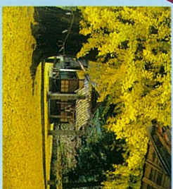
香淀の大イチョウ