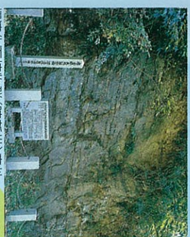
播磨化石植物群(新新世)産地