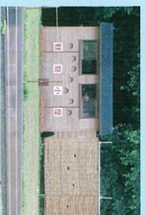
ツクボウリョウ観音小屋