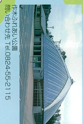
作木あおい公園 問い合わせ先 Tel.0824-55-2115