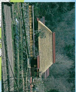
飯敷 問い合わせ先 Tel.0824-55-2115 至赤名