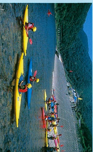
江の川カーン公園ささき 問い合わせ先 Tel.0824-55-7050