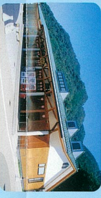
ツボウソウ観察小屋