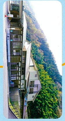
文化センターさくぎ ■問い合わせ先 Tel.0824-55-2115