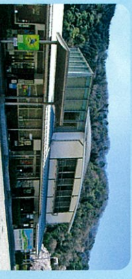
江の川カヌー公園さくぎ ■問い合わせ先 Tel.0824-55-7050