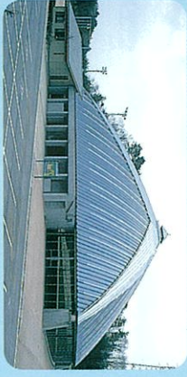
作木ふれあい公園 ■問い合わせ先 Tel.0824-55-2115