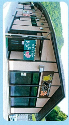
くまみ湯(カヌー公園) ■問い合わせ先 Tel.0824-55-7050