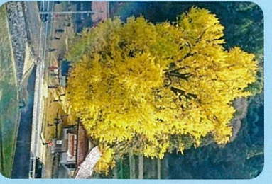
香淀の大イチョウ