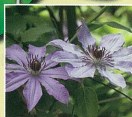
カザグルマ (5月初旬~中旬)