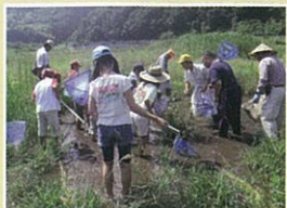
知和ウェットランド