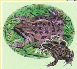
ダルマガエル (5月初旬~10月上旬)