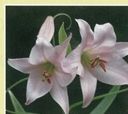
ササユリ (6月中旬~7月初旬)