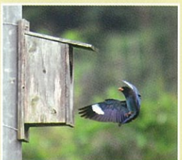
プッポウソウ (5月初旬~8月下旬)