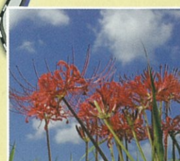
ヒガンバナ (9月上旬~9月下旬)