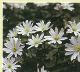
ユキワライチゲ (2月中旬~3月中旬) 開花時間 (晴天の日 11:30~15:30)