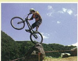
トライアルパーク