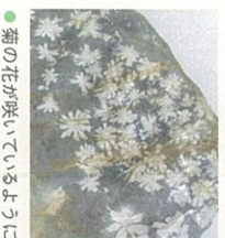
● 菊の花が咲いているように見える「菊花石」。

曲がる石、叩くと綺麗な音が響く石、模様が花や風景面に見える石など、自然が作り出したユニークな石の数々。実際に触れ、感じることで、驚きが「知りたい」に変わっていきます。