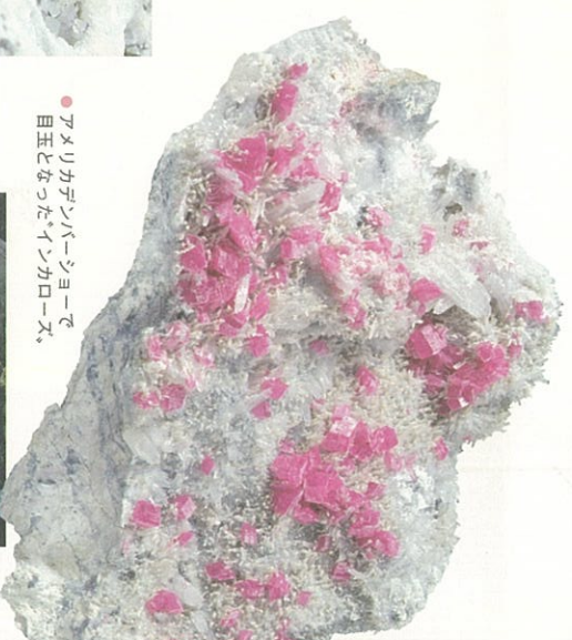
● アメリカカンバーシャーで、自玉となった「インカローズ」。