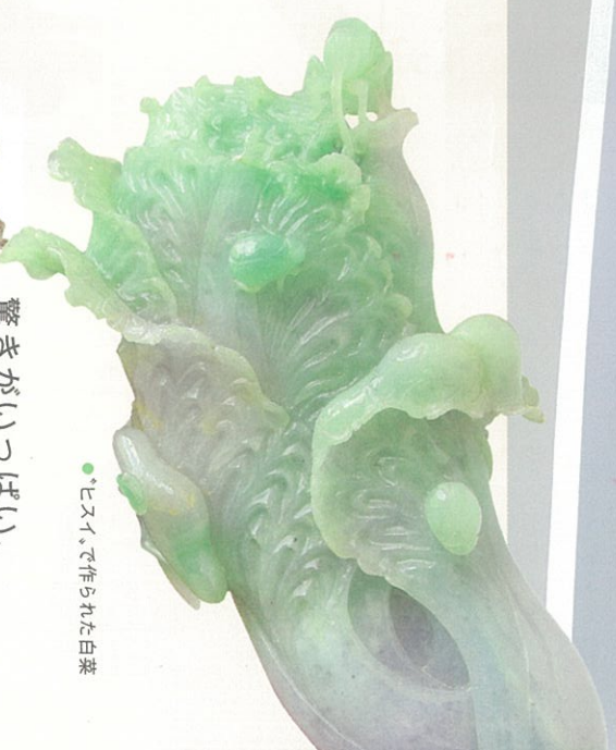
● ヒスイで作られた白菜