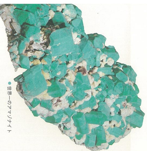
● 世界一のクワンサイト

地球が生み出した美しい結晶たち、その色や形、輝きは多種多様です。光る石、空や大河のような石...。幻想的で不思議な石の世界は驚きや感動がいっぱい。ここでしか見られない大きく美しく珍しい石たちの、当館自慢の鉱物コレクションです。