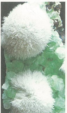
● スコレス沸石と魚眼石