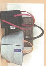
● 豊岡製と柘榴ハッパ