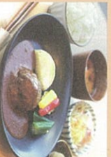
● 但馬牛ハンバーグランチ

「シストランチ&カフェ玄武洞」では、地元食材をかんだんに使った四季折々のメニューを味わうことが出来ます。目の前に広がる円山川の風景とあわせてお楽しみください。