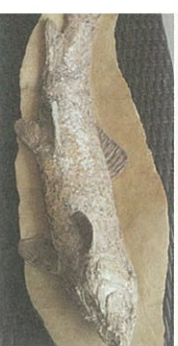
● 今にも動き出しそうな魚の化石