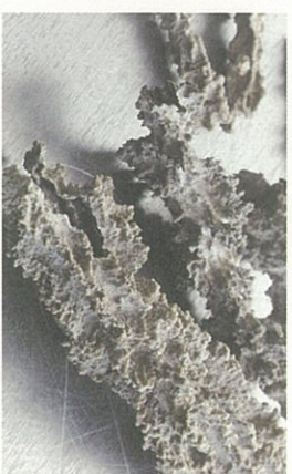
● 砂漠にカミナリが落ちてきた「雷管石」。