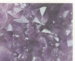
● 玄武岩の中に生まれる「アメジスト」。