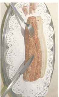
● まるで豚肉のように見える石