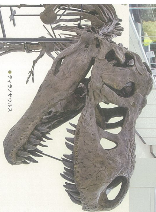
● ティラノサウルス