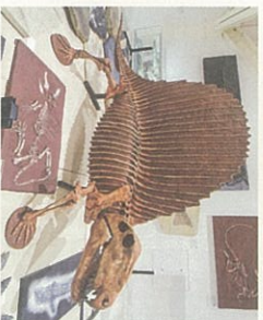
● 大きな蛾をもつ「ティマトロフ」。