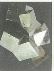
● 四角の結晶が連なる「黄鉄鉱（おうてつこう）」。