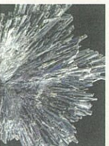
● 刀のように輝く「鱗安鉱（まへんこう）」。