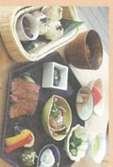
● かご手まりむすび膳