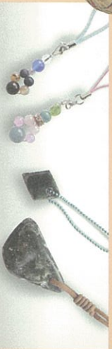
● 天然石キーホルダー・ペンダント作り