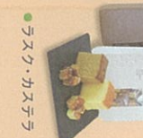
● ラスク・カステラ

ミュージアムショップでは、珍しい石や化石、恐竜グッズの他、但馬のお土産や豊岡製、豊岡柘榴細工の御ハッパなどをどの種類も豊富。旅のお土産が全てそろっています。