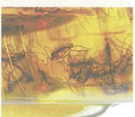
● 何年も前の昆虫が樹脂に閉じ込められた「琥珀（ごはく）」。