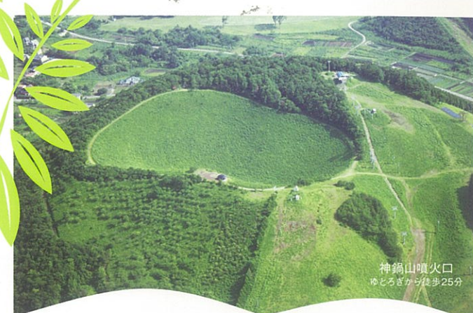
神鍋山噴火口 ゆとろぎから徒歩25分