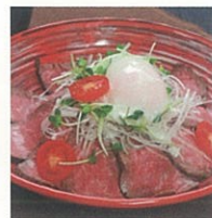
但馬牛 ローストビーフ丼