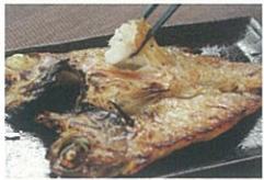
ジオが育む農・海産物

地元でとれた新鮮な農産物・海産物（冷凍）、加工食品などを販売しています。その季節の美味しい物が並んでいます。