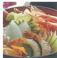
浜坂地えびと 海鮮五種盛丼