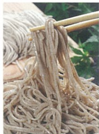
春来そば てっぺん 道の駅店

つなぎを一切使わない昔ながらの十割手打ち蕎麦を提供している、春來峠のそば処「てっぺん」の2号店です。打ちたての味を道の駅でもお楽しみいただけます。