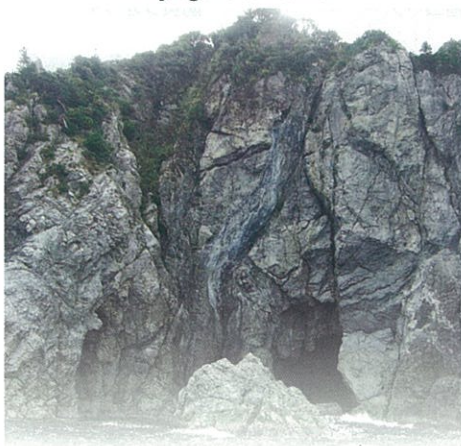
花崗岩の割れ目のマグマの模様が龍に似ていることから名づけられました。