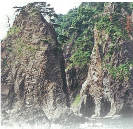
黄金色に輝く島と龍宮洞窟の岸壁が美しい。