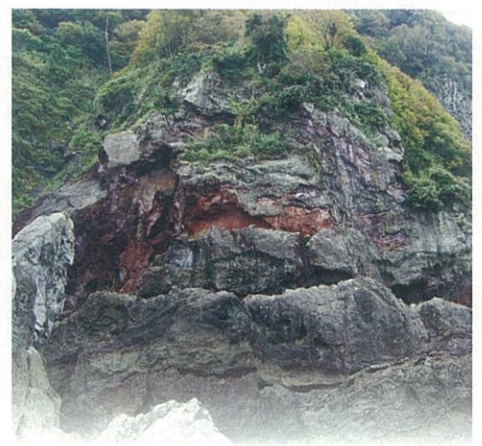
2500万年前頃の日本海誕生にかかわる溶岩です。