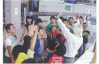
砂礫の沈殿の実験