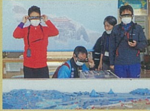
スマートグラスで見学

The San'in Kaigan Geopark Center is a material Center where the outline of Geopark can be understood. In the Center there are a variety of rock specimens