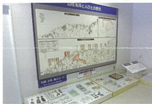
考古・歴史コーナー