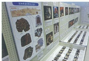
鉱物展示コーナー