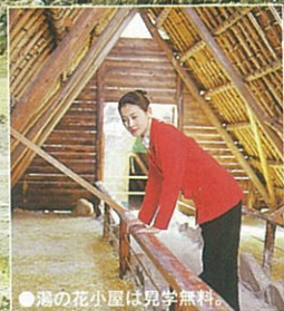
●湯の花小屋は見学無料。