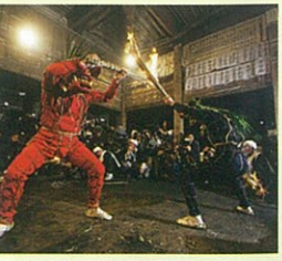
立ち寄り 歴史資料館 おにえ 鬼会の里

国の重要文化財である阿弥陀如来坐像が安置され、心穏やかなひとときを過ごすことができます。修正鬼会(しゅじょうおにえ)にちなんで「鬼の目そば」が頂ける食堂や、修正鬼会の迫力が体感できるシアターも用意されています。