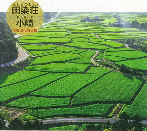
田染荘小崎 重要な文化的景観