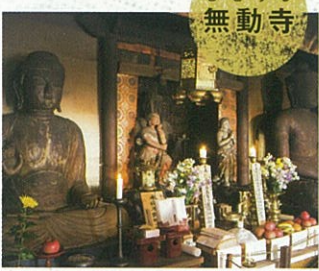
無動寺 奈良時代初期に開かれた天台宗の名刹。不動明王像や大日如来坐像など16体もの国指定有形文化財が見られます。薬師如来は、六郷満山に残る木像のなかで最も大きい尊像です。