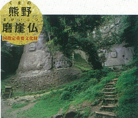
熊野磨崖仏 国指定重要文化財

開山から1300年を数える六郷満山文化。神仏習合による独自の文化が息づく豊後高田市は、自然豊かで厳かな空気が漂う神秘的な地。古より歴史を重ねてきた神社仏閣をめぐり、そこに刻まれた千年の祈りにふれてみましょう。