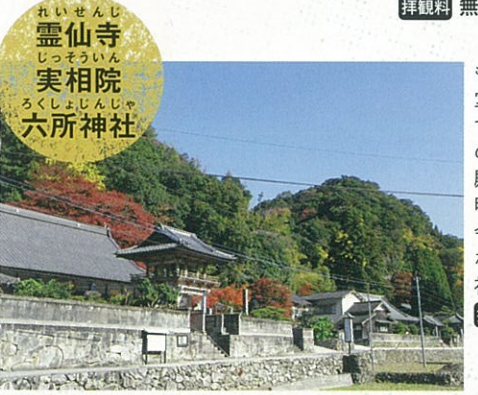
霊仙寺 実相院 六所神社

もともとは霊仙寺の講堂として実相院が建てられ、六所神社はその神殿と霊仙寺の仏殿を収めていました。明治時代の神仏分離令により、現在のような独立した3つの神社仏閣となりました。