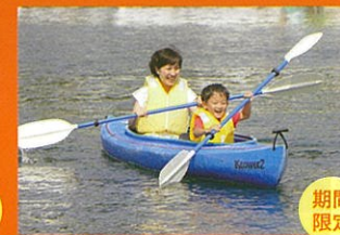
シーカヤック 〈一人乗り7艇 二人乗り20艇〉