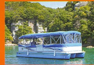
九十九島リラクルーズ 〈定員12名〉