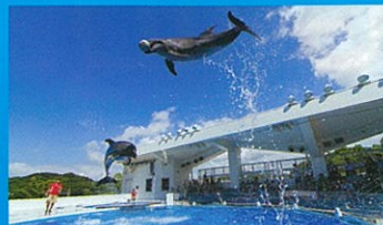
イルカのプログラム