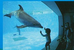
九十九島イルカプール