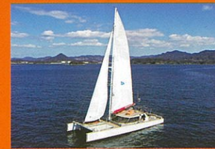
カタマランヨット「99TRITON」 〈定員30名〉