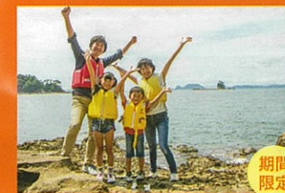
無人島上陸とエサやり体験クルーズ 〈定員10名〉