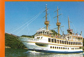
九十九島遊覧船パールクイーン 〈定員280名〉

クジュウクリン 白い船体が美しい「パールクイーン」やカタマランヨット「99TRITON」など、九十九島を様々な角度から楽しむことができるクルージングメニューがいっぱい!