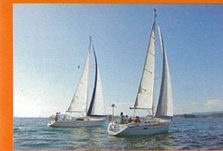
ヨットセーリング 〈定員10名〉