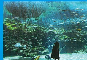
九十九島湾大水槽