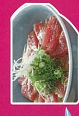
津久見の ひゅうがが丼