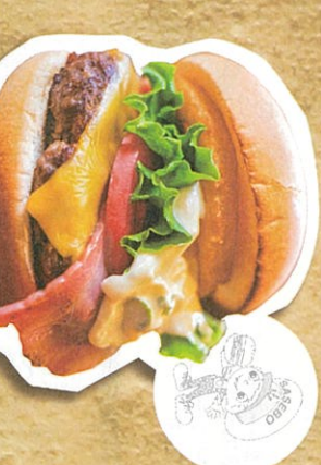
佐世保バーガー 850円(税込)

ハワイアンホースの運河を眺めながら癒しのひとときを 3階建てのサリユートンビルに隣接!観光車も見える絶景の ローションで天気が良い日には「アイロ」が人気!アイロ オリジナルの「アイロ」に店内仕込みの「アイロ」を使用した ソースが「アイロ」が人気!アイロは「アイロ」限定メニューも。