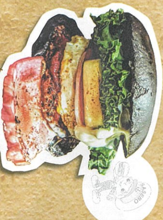
KORON Burger 1,300円(税込)

進化系佐世保バーガーの店 佐世保バーガー認定店では唯一の竹炭焼パンを使用し ております。佐世保バーガーランキンガ2連覇達成中。 googleマップで詳細をご覧ください。