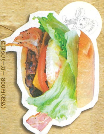
佐世保バーガー 800円(税込)

厳選した材料を使っています! パンは、九州産の小麦を使っています。 パンは、国産産品を使っています。 パン職人が、生地から手作りしているパンのバーガーです。 ※ご注文の多い時間帯はご注文のほどお預めします。