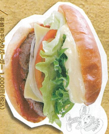
長崎和牛A5バーガー 1,000円(税込)

ハワイアンホースが一番熱い店! ハワイアンホースに自家製ソースの「アイロ」や、熱々の鉄板 に乗せて提供する約熱「アイロ」など、「アイロ」メニュー 満載です。