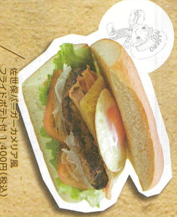
佐世保バーガーカメリア風 フライトホント付 1,400円(税込)

ホテルシェフが創るこだわりの味を満喫!! ホテル内バーガーシヨツク「カメリア」の「アイロ」と甘い自家製ソースが自慢の逸品。ソースからまる半熟卵と「アイロ」の肉汁が絶妙なハーモニーです。