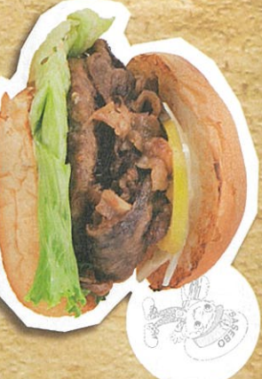
長崎和牛A5等級シシトビステーキバーガー 1,500円(税込)

長崎和牛A5等級のシシトビステーキと長崎和牛100%の贅沢「アイロ」に入れるシシトビと混ぜる肉汁とふんわりくすねる柔らかい食感の「アイロ」。肉にこだわったこだわった長崎和牛の「バーガー」!!