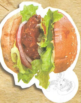
スライスチーズバーガー 840円(税込)

コーヒージュワツカを作る絶品バーガー カルカ又SASEBO内にある人気のあるコーヒージュワツカ。王道のチーズバーガーやチヂミを使用したチキンのバーガーが人気です。 その他、ドリンクやスイーツも豊富な種類をご用意してお待ちしております！