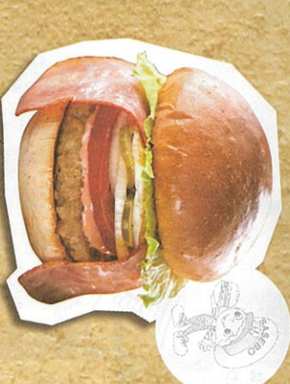
キングダムバーガー 950円(税込)

大人から子どもまで、みんな大好きな味 ホリユートンビル100/「アイロ」を使用!新鮮野菜とハンコン&目玉焼に絡んだ「アイロ」が絶品!お肉とお肉が絶品!お肉とお肉が絶品!