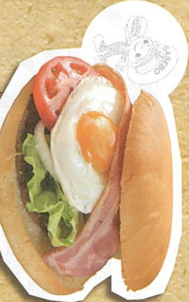
佐世保バーガー(ホント付) 880円(税込)

レストランでいただいたバーガー 程よい甘さの特製ソースが牛肉100%の「アイロ」と絡んで美味しさアップ。半熟卵とシヤキチとした食感の新鮮野菜がやみつきになる味。