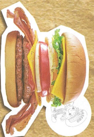
極濃バーガー 1,518円(税込)

ハワイアンホースに一番近い老舗「佐世保バーガー ヒツタツシ」 2019年9月エリナ大塔店にOPEN！「食への矜持」が ハンバーガー部門「西日本第1位、創業1970年、老舗の味を ご賞味ください。大量注文承ります。