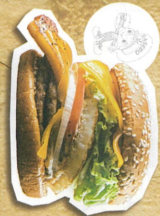
W(オツリ)バーガー 1,300円(税込)

あなたもきっと好きになる、こだわりの味。 W(オツリ)国産豚牛肉100%の手ごね「ライオン」W(オツリ)濃厚チーターソース。こだわりの厚切りバーコンが入った、088人気No.1のW(オツリ)バーガー。旨味・酸味・塩味・甘味・旨さの佐世保バーガーの思い出しに楽しめる! 電話注文可!