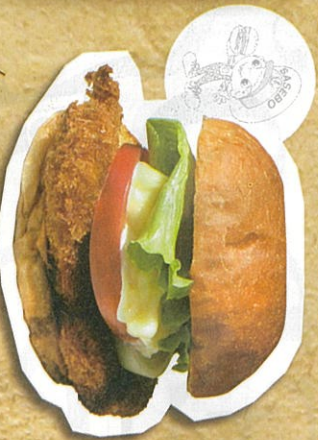
大きなたりやきチキンカツバーガー 550円(税込)

シューシーなチキンに思わず笑顔が!! とりも肉をじっくり味付けしてカリッと揚げ、自家製のふかふかパンズに挟んだ「とりやきチキンカツ」バーガーは、子ども大人も大好きな味!