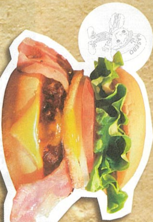
Y's Sasebo Burger 990円(税込)

米軍さんから「BEST EVER」と言われた味 とろりとしたまごがたまらない、濃厚でシューシーなY's Burgerスタイルの佐世保バーガーです。