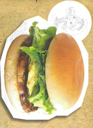
スナーキバーガー 700円(税込)

パールシーのソーサイドどうぞ 人気No.1は(ハ)と一緒にかみ切れる柔らかい肉のステーキバーガー。パールシーなジャボソー又は新鮮野菜や炒め玉ねぎも相性◎!