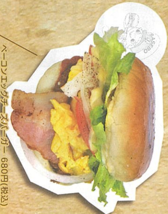
バーコンエックバーガー 680円(税込)

防空壕の中のハンバーガー一店! 地味中に作られた防空壕の中で元洋食シェフが焼き上げる肉厚でふわふわたまごの「バーガー」。