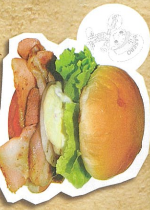
元相バーコンエックバーガー 858円(税込)

譲れない! 発祥店のこだわり 食の安全No.1、40余年の実績が作り出す1日、1000個売れたバーガー。一口の中でボリュームと旨みが出す自家製バーコンは、バーコンエックバーガー発祥店のこだわりの味。電話注文可。