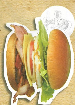
スベシヤルバーガー 968円(税込)

公園でのんびり食べる佐世保バーガー リニョ-アールした佐世保中央公園アーケード内にあるお店です。青空の下、老舗の味をど真味ください。