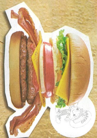
標準バーガー 1,518円(税込)

老舗のバーガーをゆったりと味わえる 創業1970年の老舗であるビッグマンのアーケード内店舗。店内40席でゆったりとした雰囲気の佐世保バーガーを堪能できる。電話注文、Uberにも対応。