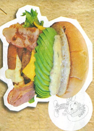
ABCバーガー(A)ホカト(B)ニコソ(C)チーシ 1,200円(税込)

★九州グルメツアー2位の味★ パールシーより車で4分、動物園通り車で2分、目の前にはカナル島が一望できる「バーガーミュージアム」である店内は見えて、食べて楽しい「バーガーミュージアム」地元の味も楽しめる! 全部自家製手作りの「バーガー」が人気のヒミツ★