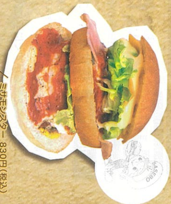
ミサモンスター 830円(税込)

ふっくらパンズにタケルのパテ! 3分割した自家製パンズにビーコン、エッグ、チーズ、2枚のパテをサンド。旨さも怪物級のミサモンスターは特製の甘辛ソースが味の決め手。