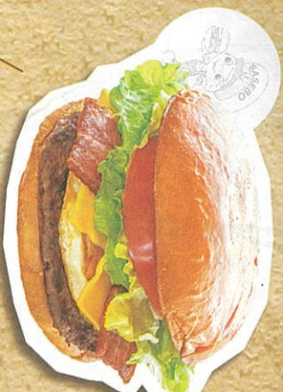
スベシヤルバーガー(レギュラー) 1,361円(税込)

佐世保駅で食べられる老舗店の味! ホリユ-ム満点のバーガーを旅のお供、お土産にいかが? 電車の時間に合わせ作り出してくれるので、予め電話予約をしておくのがオススメ!