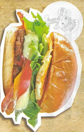
佐世保スベシヤルバーガー 830円(税込)

自家製のふかふかパンズに美味しさキユツ 自社のパン工房で焼くパンズに、数種類のスパイスを効かせた昔ながらの手作りライオンと甘めのマヨネーズをそしてボリュームアップの具材がはさまれたスベシヤルバーガー。