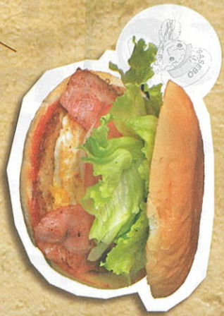
シヤンボチキンスベシヤルバーガー 840円(税込)

手作りの味を頑固に守る老舗店 この店が学生向けに作ったのがシヤンボバーガーの発祥。市民に親しまれてきた味を守り、幅広い年齢層に愛される「バーガー」は納得の旨さだ。