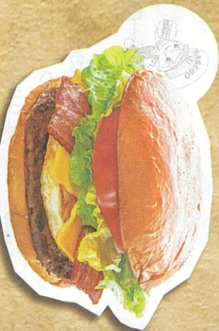
スベシヤルバーガー 1,386円(税込)

味も大きさもまさにスベシヤル ビー100%のシューシーな「ライオン」肉厚ビーコン、野菜も盛りたくさ。しっかりと食感を感じていただける「フランス端」のバーガー。ホットソースも人気! 電話注文OK!