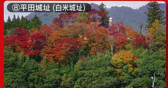
⑧平田城址(白米城址) 見頃：10月下旬～11月下旬