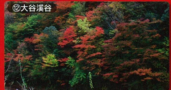
⑫大谷溪谷 見頃：10月下旬～11月下旬

お問い合わせ先 中津市役所 耶馬溪支所 総務課 TEL (0979) 54-3111 FAX (0979) 54-2646 〒871-0405 中津市耶馬溪町大字柿坂 138 番地 1