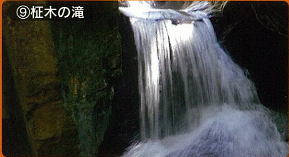
⑨柁木の滝 見頃：10月下旬～11月下旬