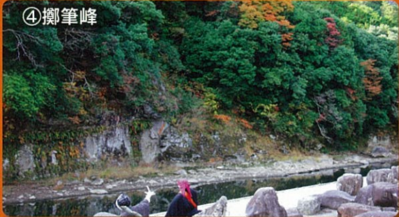
④擲筆峰 見頃：10月下旬～11月下旬