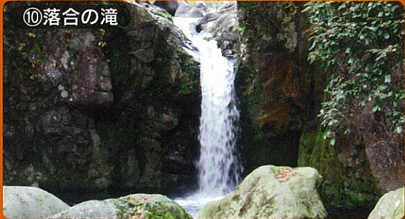
⑩落合の滝 見頃：10月下旬～11月下旬