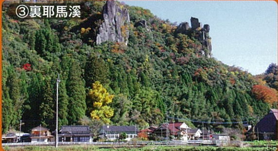
③裏耶馬溪 見頃：10月下旬～11月下旬