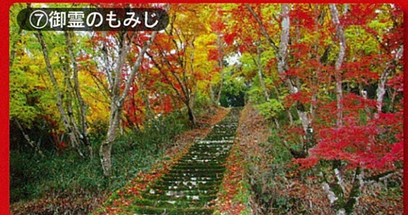
⑦御霊のもみじ 見頃：11月中旬～11月下旬