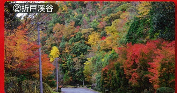
②折戸溪谷 見頃：10月下旬～11月下旬