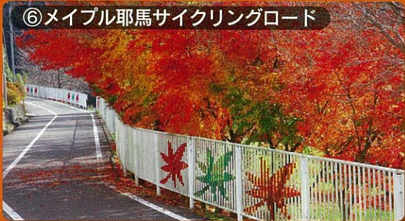
⑥メイプル耶馬サイクリングロード 見頃：10月下旬～11月下旬