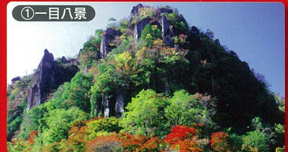
①一目八景 見頃：10月下旬～11月下旬