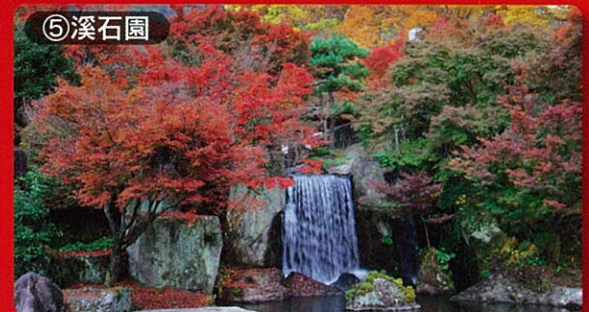
⑤溪石園 見頃：10月下旬～11月下旬