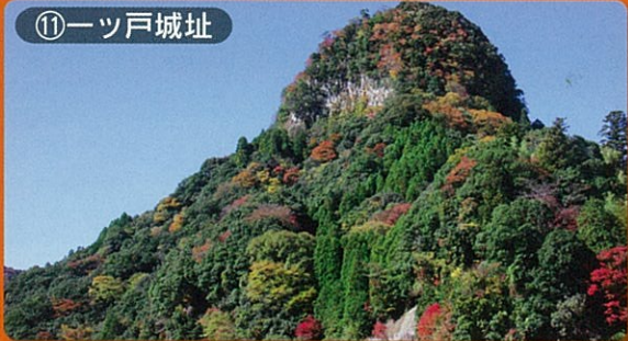
⑪一ツ戸城址 見頃：10月下旬～11月下旬