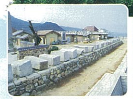
大坂城築城残石群