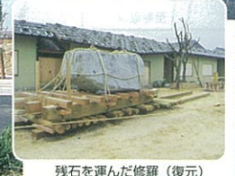
残石を運んだ修羅（復元）

ロープウェイから見る寒霞渓 千三百年前の火山活動で誕生した、奇岩怪石の渓谷は、日本三深谷美のひとつ。大自然の神秘を標高差三メートル全長九七メートルのロープウェイから体験。春のつじと新緑、夏の碧、秋の紅葉、冬の深閑。四季の移り変わりをお楽しみ下さい。