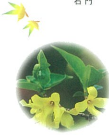
ショウドシマレンギョウ