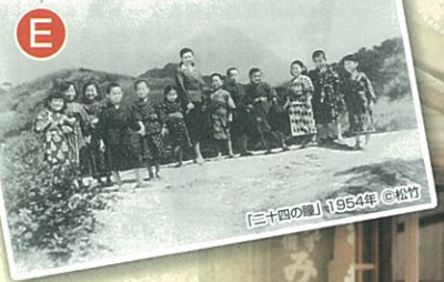
「二十四の瞳」1964年