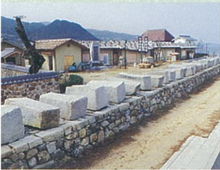
大坂城築城残石群