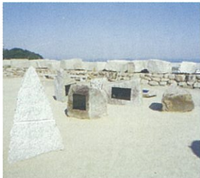
瀬戸内国際芸術祭出展作品