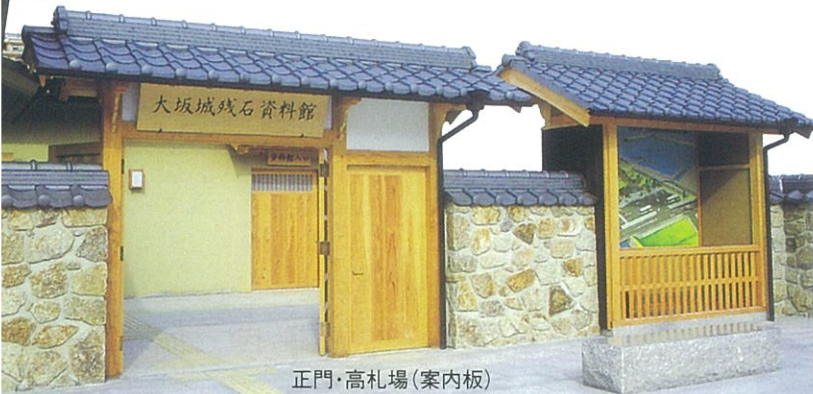
正門・高札場(案内板)