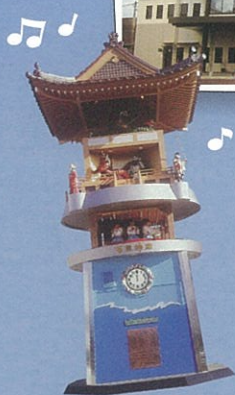
浜田駅前のどんちっち神楽時計 朝日時から午後9時まで毎正時に 神楽のからくりが作動します。