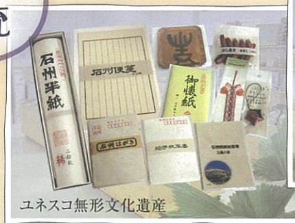
ユネスコ無形文化遺産