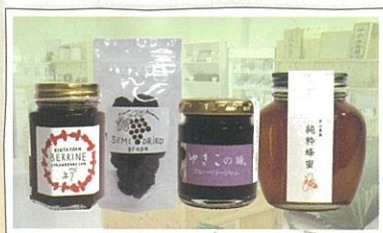
ほっぺがおちそう。