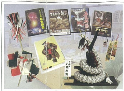
どんどんちっち、どんちっち…。