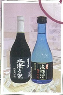
おいしい米+きれいな水 =旨い酒。