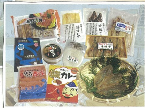
新鮮な海の幸にひと手間加えました。