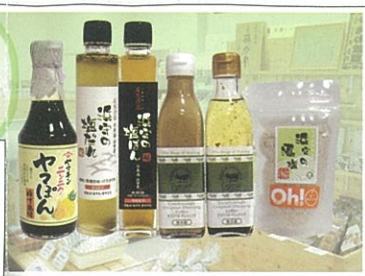
こだわりの素材で浜田の味に。