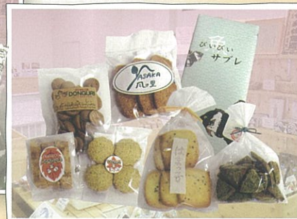
手作りの素朴な味。