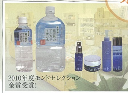
2010年度モンドセレクション 金賞受賞!