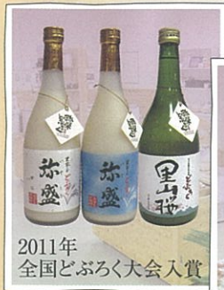
2011年 全国どぶろく大会入賞