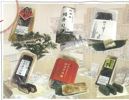
サバ、アジ、のどぐろ、わさび葉…。 売り切れの時はゴメンナサイ。