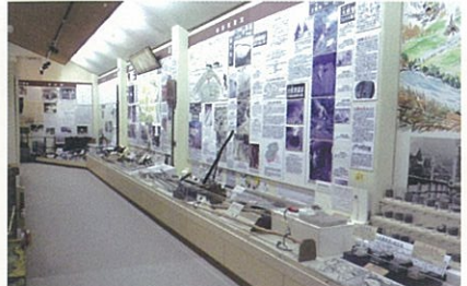
「たたら資料コーナー」

第1展示棟は「たたらコーナー」と「有形民俗資料コーナー」「釜上鉄道コーナー」に区分され、「たたらコーナー」には実物の1/3の可動模型のほか、たたらの原材料、用具・製品などが、写真・図面とともにわかりやすく解説展示されています。