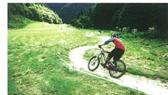
夏の瑞穂ハイランド