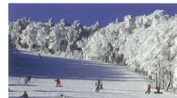
冬の瑞穂ハイランド

邑南町には、西日本最大級のスキー場瑞穂ハイランドがあります。広くて長い13ものコース、ナイター、人工雪でスキーヤーもスノーボーダーも楽しめます。飲食店も充実しており若者から家族連れの方など県内外から多くの観光客が訪れます。寒い季節は天然温泉や展望風呂も最高♪