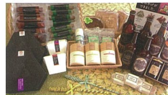
クラフト館で地域のお土産