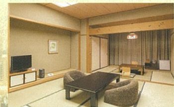
和室 16室 上下動揺りごたつ完備