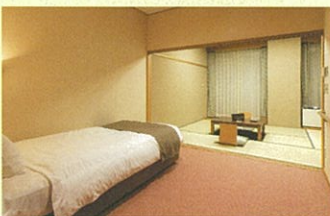
バリアフリー和洋室 1室 車イス対応トイレ、バス、洗面台完備

ロビーや廊下も段差なしでスムーズ。玉峰山荘は車イスのお客様にも安心してご利用いただけますようバリアフリー対応いたしております。