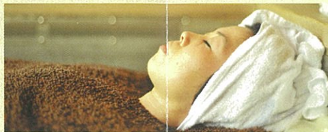
《山陰唯一》サンドバス

丸い球状の石が、全身のツボを刺激し、体全体が「ドクンドクン」鼓動します。ご入浴後は、浴槽洗浄の際、体の悪い部位から排出された老廃物が出ているのが目で見て分かります。