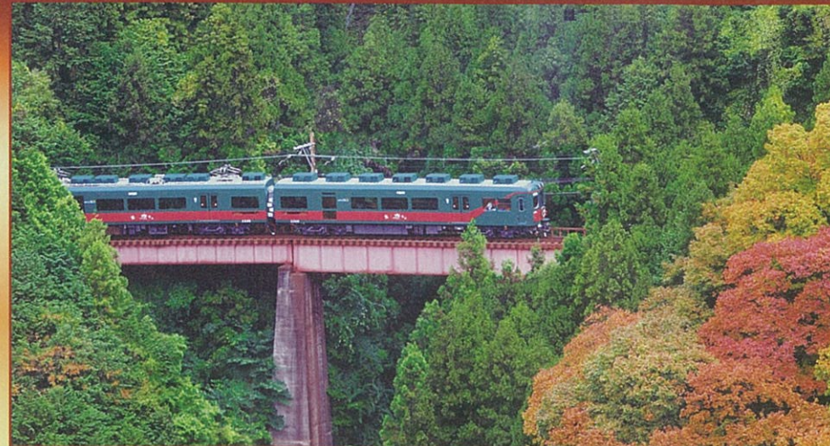
パノラマ風景が満喫できる「ワンビュー座席」

険しい山間を縫いながらゆっくりと走行する列車「天空」。高野山麓の自然や四季を五感で感じながらゆったりした旅をどうぞ。