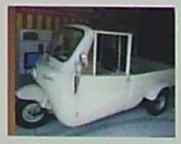
昭和のオート三輪「ハンビー」