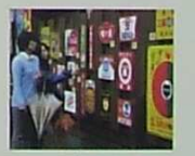
ホーロー看板コレクション