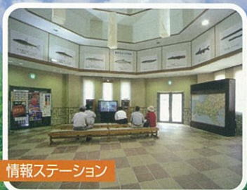
情報ステーション