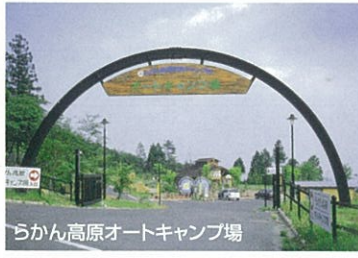
らんかん高原オートキャンプ場

羅漢山県立自然公園、木谷峡（水源の森百選）、また良質な泉質の素朴な雙津峡温泉もあり、自然とのふれあいを心ゆくまで楽しめる町です。