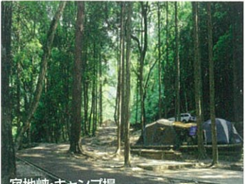
寂地峡・キャンプ場