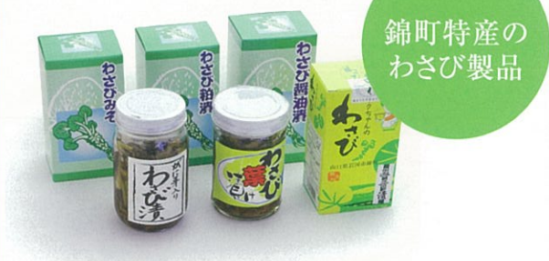
錦町特産の わさび製品