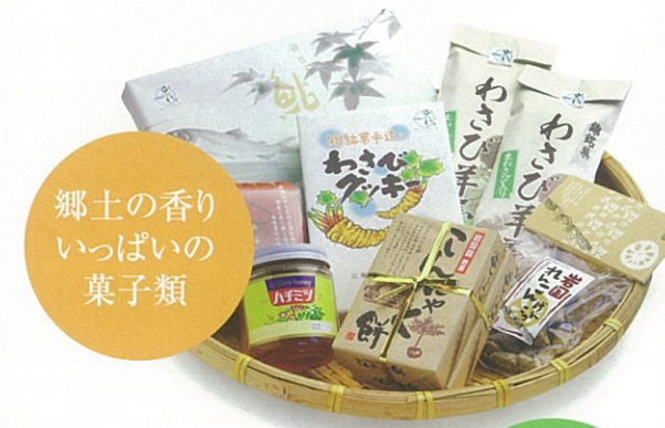
郷土の香り いっぱいの 菓子類