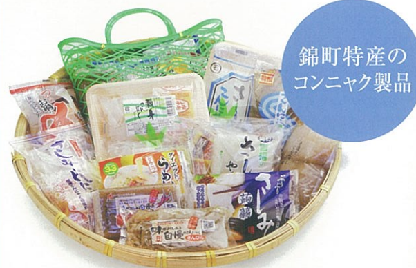
錦町特産の コンニャク製品